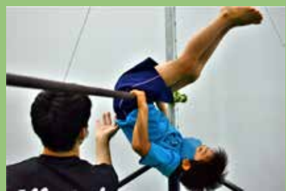
色々な練習方法を試してみよう!