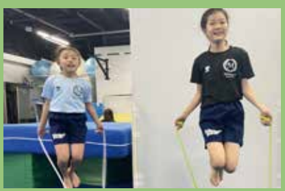
きれいに跳んで自慢しよう!