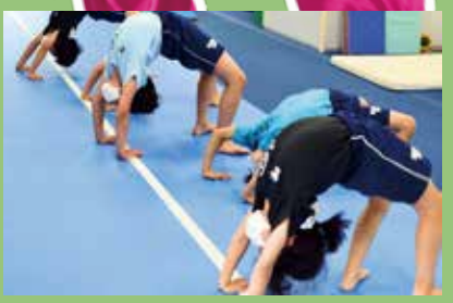
かっこいいブリッジ!

注目! 一般的に幼少期は神経系が急速に発達する時期で運動能力が伸びやすいと言われています