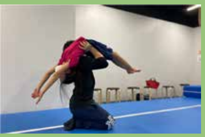
憧れのバク転にチャレンジ!